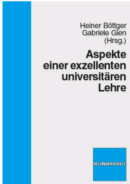
Aspekte einer exzellenten universitären Lehre Seiten 11-19